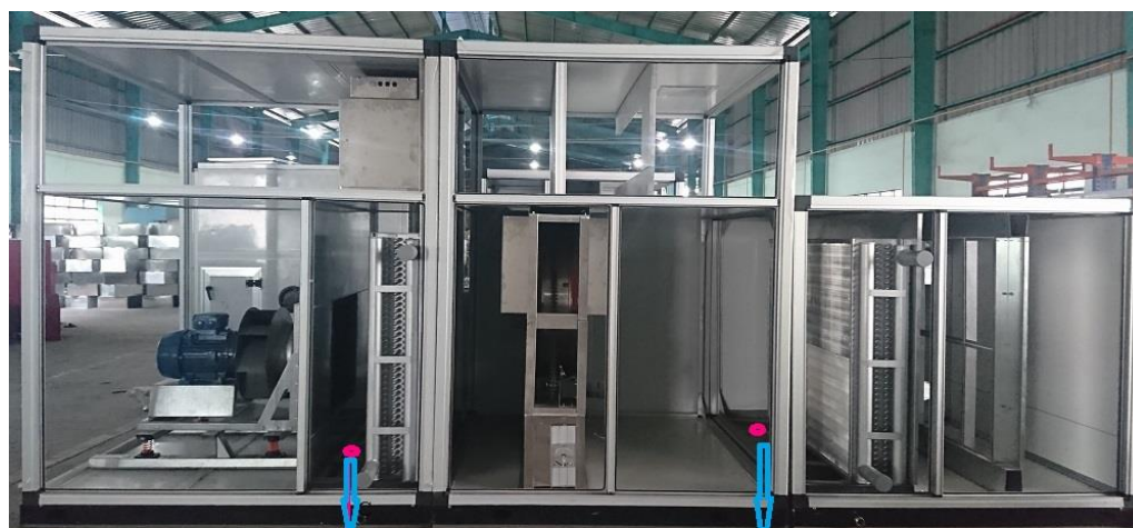
Vị trí đặt viên tại AHU